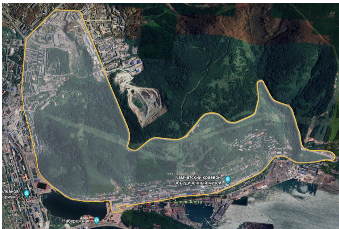
СХЕМА ТУРИСТСКОГО МАРШРУТА «Площадь им. В.И. Ленина – Смотровая площадка «На улице Высотной»