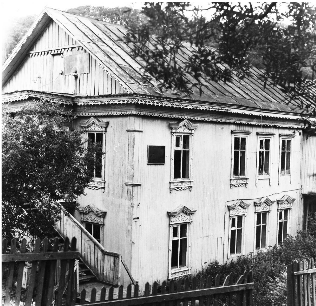
Фотография после 1950 г.