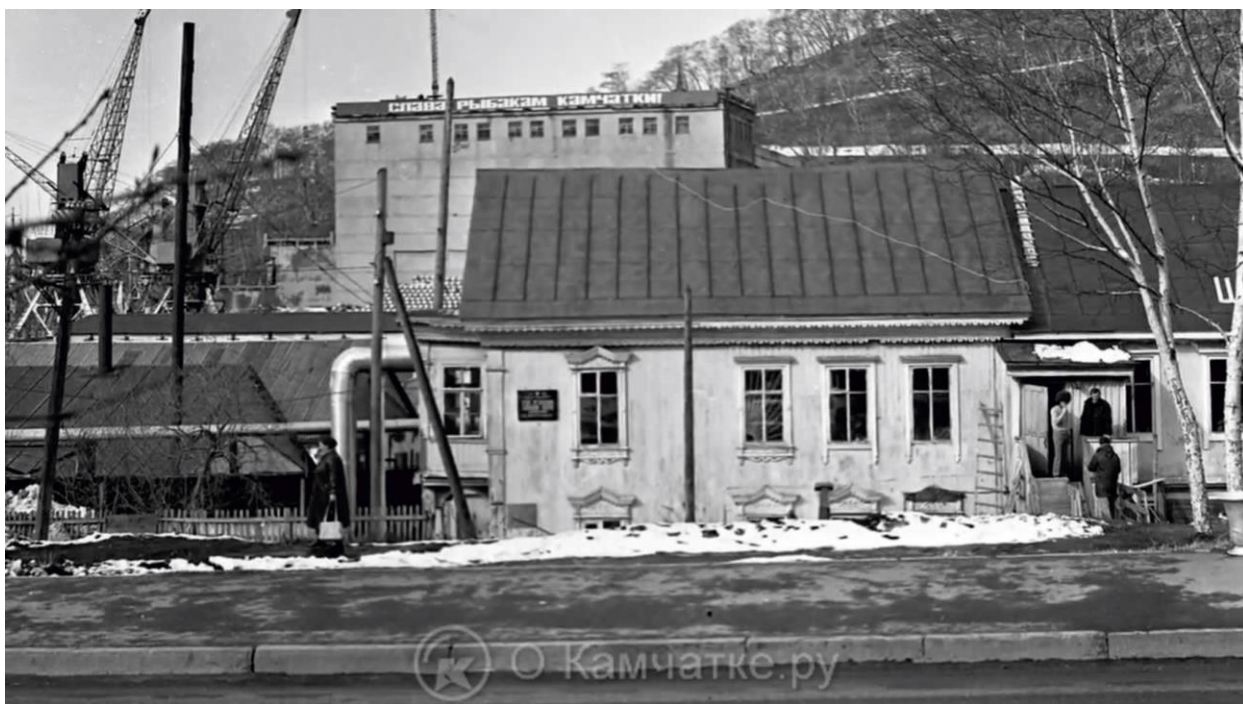
Фотография 1990-х гг.