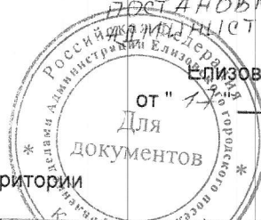
СХЕМА Границ прилегающих территории