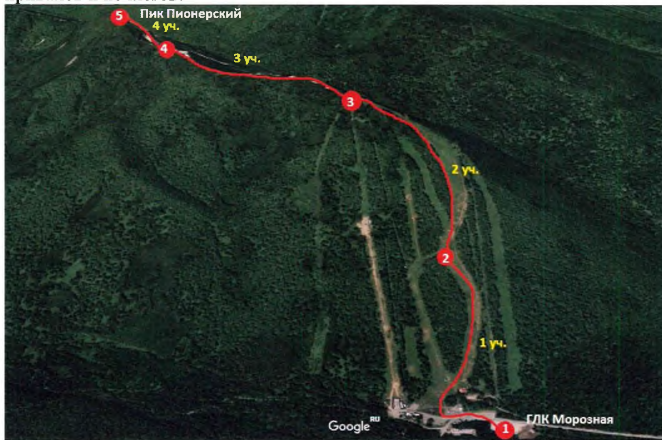
Рис. 1 Нитка маршрута

Предварительный график движения по маршруту с указанием мест остановок, привалов и ночлегов: